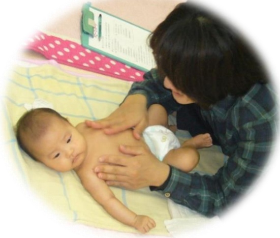
2ヶ月Tちゃん。気持ちよくてうっとり♪