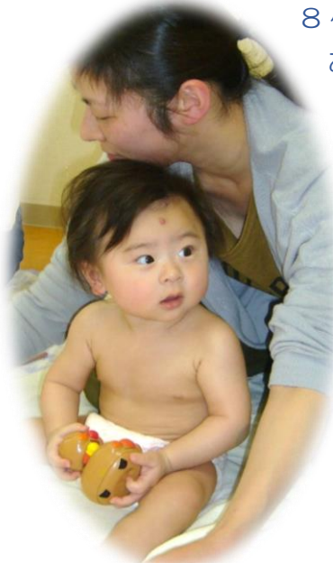
8ヶ月Rくん お座り大好き。遊びながら 楽しくマッサージ！