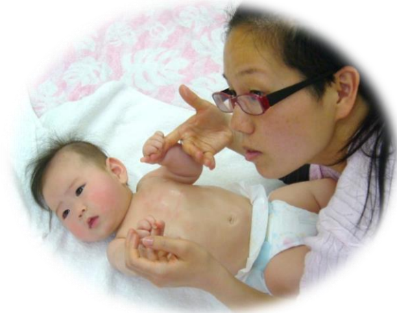
5ヶ月Rちゃん。ママに触ってもらう大好き。 終了後すぐに眠っていました。