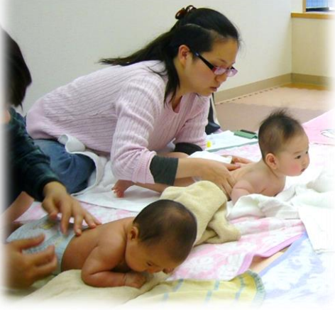
2ヶ月のTちゃん。うつぶせに挑戦！