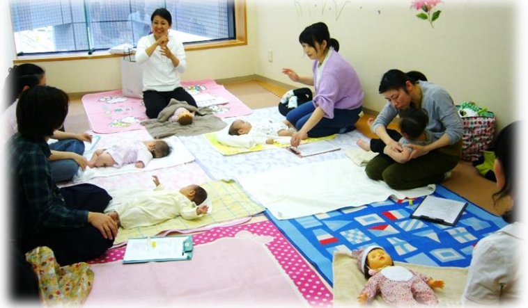
最初は自己紹介とお出かけスポットを披露 手遊びしながら、身体をゆるめていきます。