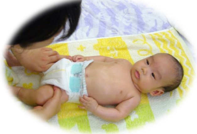
3ヶ月Yくん。ママと見つめ合って ニコニコ。