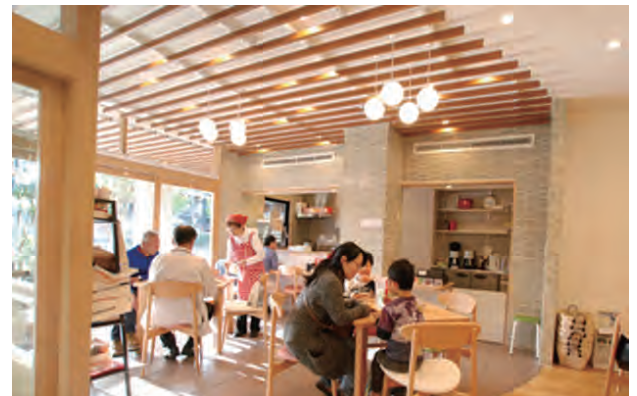
まんまん堂CAFE 外と中がゆるゆるとつながる場所に