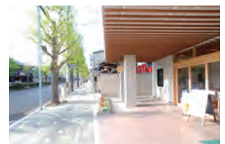
玄関周りの軒下空間は、千本通の歩道に膨らみをもたらしています