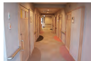
玄関周りの床を色分けし、陶板をあしらった表札を付けました。

高齢者住宅共用の食堂 夕方黄昏時、思い思いの時間に食事ははじまります。手押し車に小さな缶ビールを下げたご婦人がやってきました。