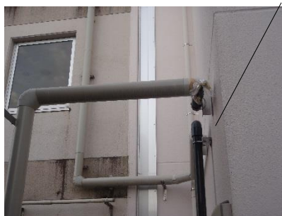
受水槽からの切り離し箇所