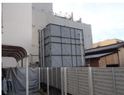
東側からみた受水槽、奥が咲あん上京

今回の撤去工事は、咲あん上京の駐輪場の確保のために実施していますが、受水槽を撤去することで、食堂に朝陽が差し込むようになる予定です。